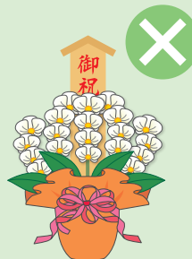
落成式・開店祝などの祝花、葬儀の供花、病気見舞いなど