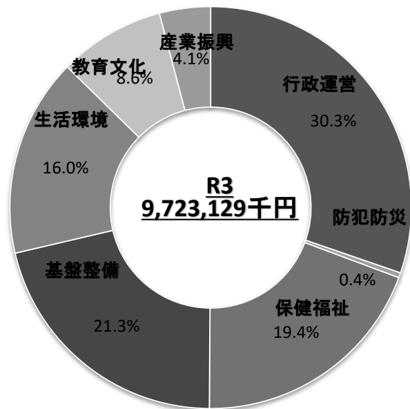
R3 分野別計画の割合